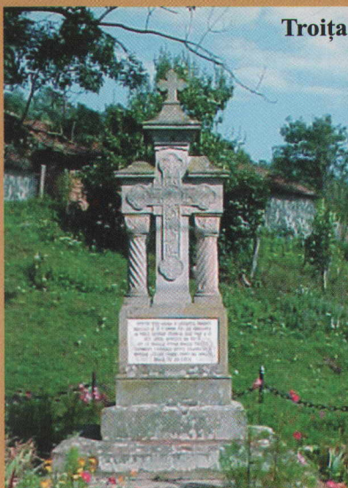
Troița Ribița - 1934