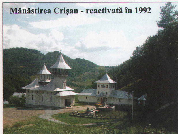
Mănăstirea Crișan - reactivată în 1992