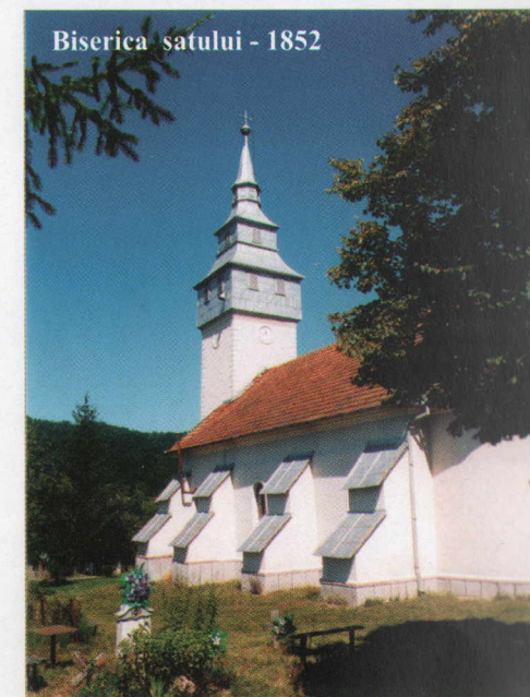
Biserica satului - 1852