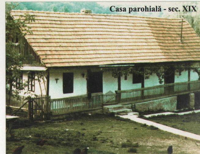
Casa parohială - sec. XIX

În acest an, expoziția din Casa memorială Crișan a primit o nouă înfățișare, ea ilustrând atât evenimentele din 1784, dar și aspecte din viața socială, spirituală și școlară a locuitorilor satului Crișan. Acum la împlinirea