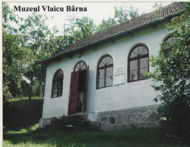
Muzeul Vlaicu Bârna

Un alt monument istoric din sat este mănăstirea Crișan. Ea a fost înființată în secolul al XVI-lea, ca urmare a trecerii nobililor de la Ribîța, împreună cu