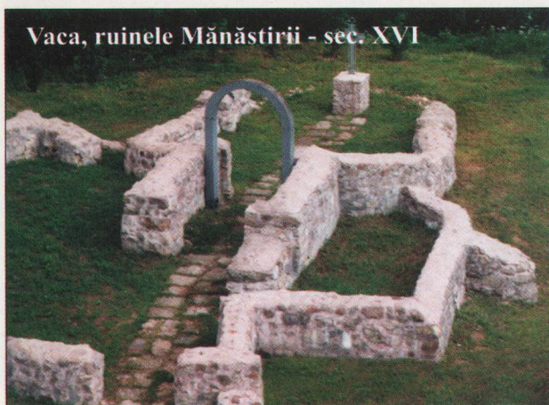
Vaca, ruinele Mănăstirii - sec. XVI