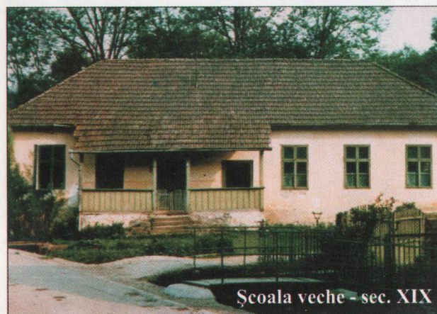
Școala veche - sec. XIX