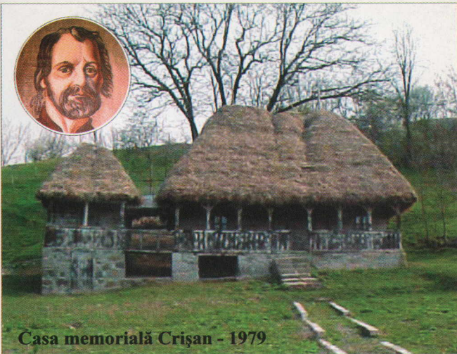
Casa memorială Crișan - 1979

Satul Crișan se află situat în Țara Zarandului, fiind atestat pentru prima dată în documentele istorice, în anul 1439, sub numele Vaca . În anul 1525, satul făcea parte din marele domeniu al cetății Șiria, având 25 de familii de iobagi. În decursul evului mediu, satul Crișan a trecut în proprietatea diversilor stăpâni feudali, începând cu acei cnezi de Ribîța, ctitori ai bisericii, Vladislav și Miclăuș, și a succesorilor lor, nobilii din familiile Ribiczei și Nemeș. În secolul al XVII-lea, satul Crișan era aservit nobililor din familiile Kapi și Gyulai, iar la începutul secolului al XIX-lea, stăpâneau satul nobili din familiile Gyulai, Farkas, Imre, Nalatz, Bethlen și Horvat.